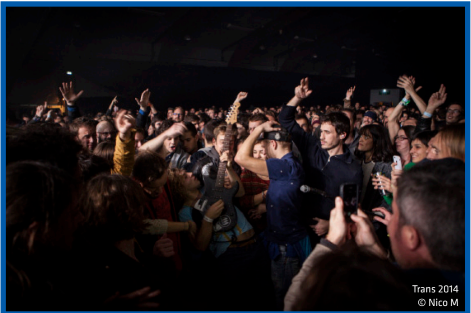
Trans 2014

Mais la découverte d'artistes se fait toujours dans un rapport de confiance.